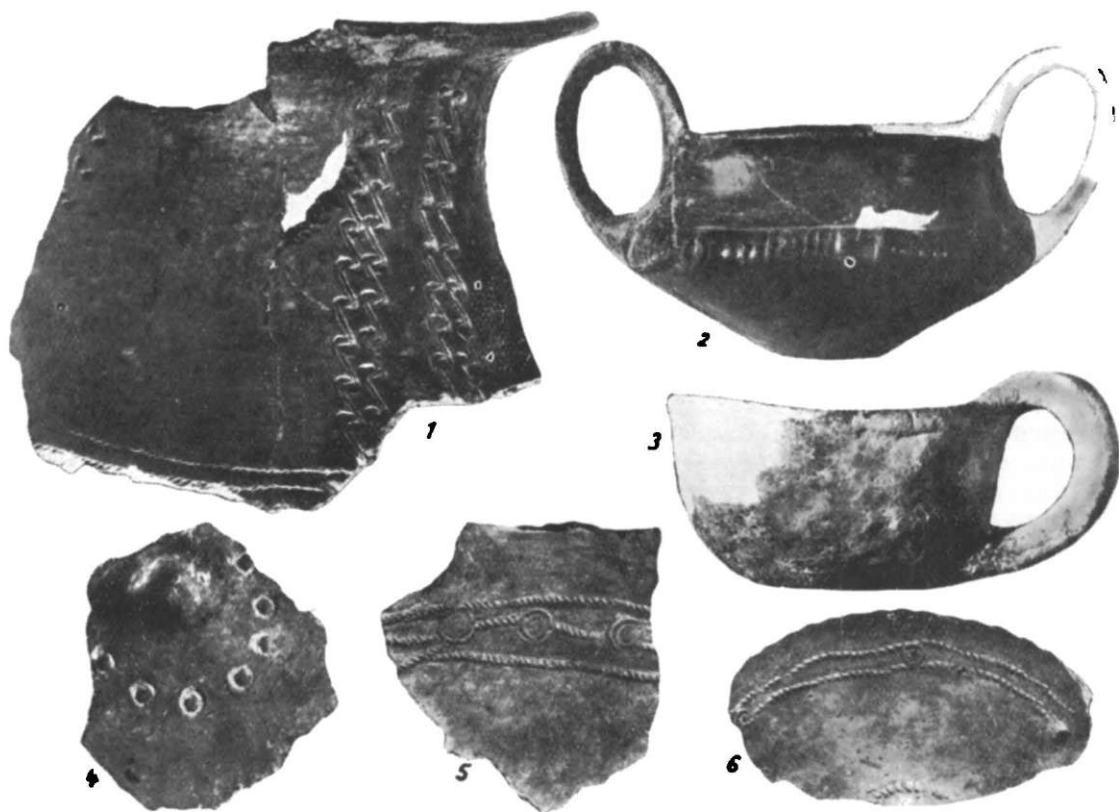
Fig. 3. — Cernavoda, «Dealul Sofia», fragmente și vase din prima epocă a fierului; vasul nr. 2 provine dintr-un mormint.

Săpăturile din sectorul D au îmbogățit conținutul culturii Cernavoda și a locuirii hallstattiene. Au fost determinate cinci niveluri de locuire, ca și în sectorul C, delimitate uneori prin locuințe suprapuse, care au mai multe urme de refacere a podinelor.